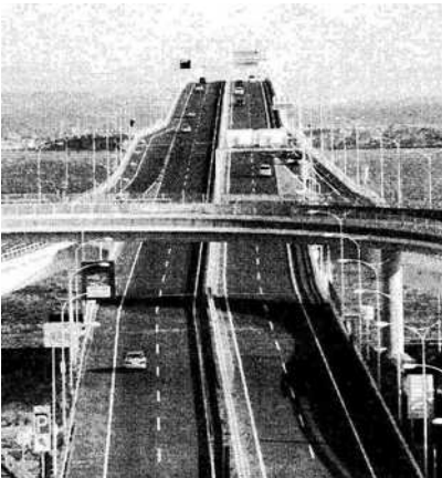
工事費1兆4千億円の東京アクアラインは、いつもガラガラ