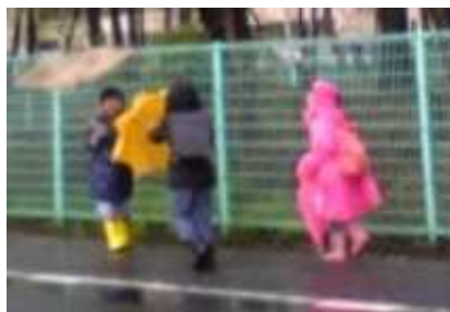
歩道のない県道。「雨の日は、傘をささずに歩きなさい」と子に。(通学路の改善ねがう母親の訴え)