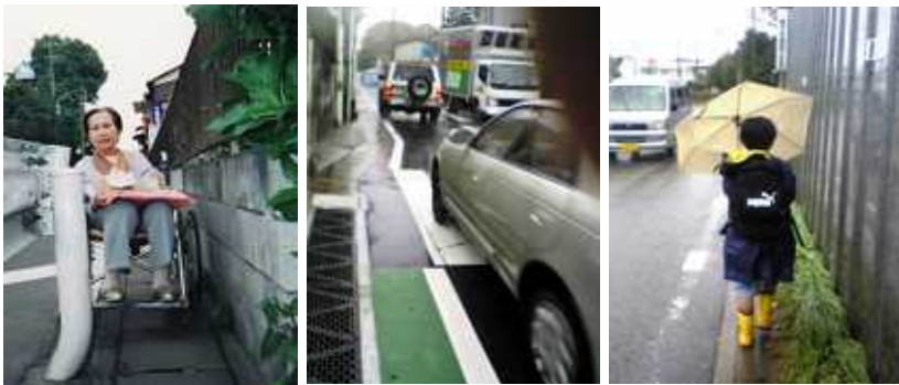
病院に通う市道も「命がけ。車椅子では無理！」