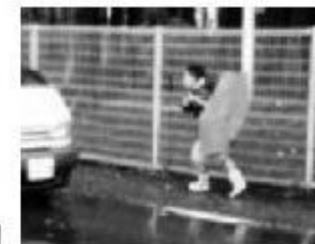
金ヶ作県営住宅建設予定地付近の県道