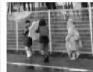
歩道のない県道。「雨の日は、傘をささずに歩きなさい」と子に。(通学路の改善ねがう母親の訴え)