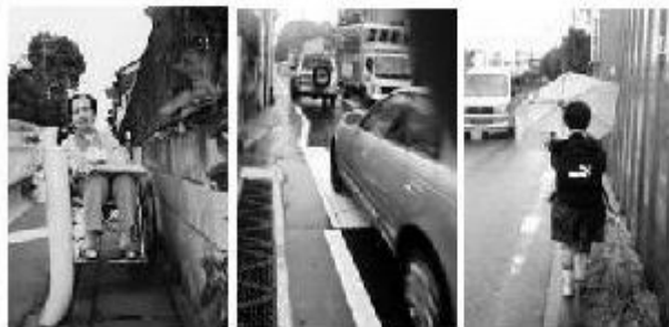
病院に通う市道も「命がけ。車椅子では無理!」