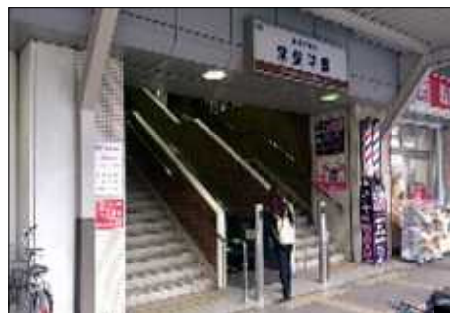
新京成常盤平駅南口 来年3月 エレベーター完成予定

JRホームのエレベーター等の工事は2018年度末までの見込みで、完成したものから順次供用開始を予定しています。