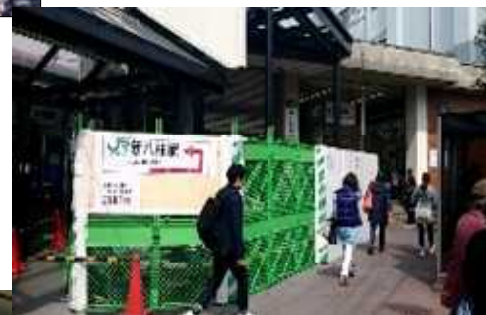
新京成松戸駅 来年3月エレベーター完成予定 JR松戸駅 2019年3月 工事完了予定