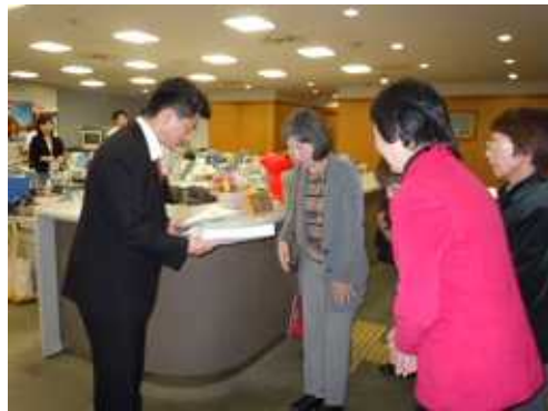
10月31日千葉県知事への署名を提出

今年2月12日、第2次署名560筆合計2,286筆を千葉県警察本部に提出した時、「このあたりに信号と横断歩道が必要と認識している」と千葉県警本部は答え、取り組みは前進しています。信号設置実現のためご要望とご意見、お力をお貸しください。3月26日の報告会へのご参加をお待ちいたします。