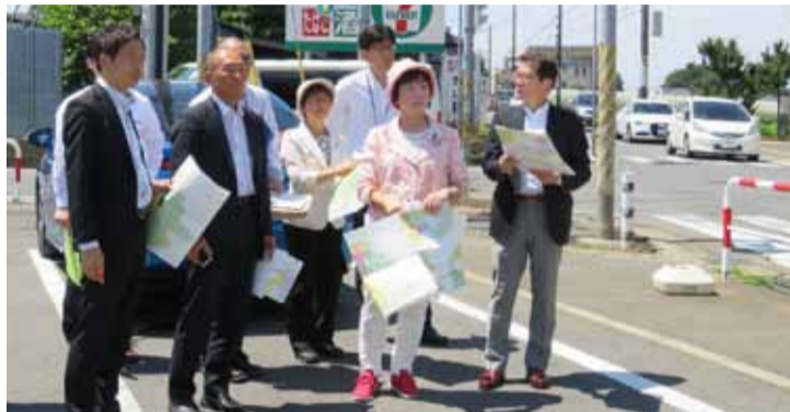
北千葉道路建設予定地を視察

圏央道、北千葉道路など巨大大道建設につぎ込むお金は3500億円。1兆円規模の第二湾岸道路の復活を狙っています。水余り、洪水対策に効果がないハッチダム県の負担は464億円です。